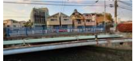
②⑭六浦二号橋(ココス前)