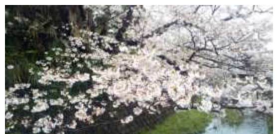
雨に濡れる侍従川の桜 3/26 撮影

《編集後記》今年の桜の開花は早く、ゲンジホタルの初見も5/2と早かったです。去年の大道溪谷のホタルは、451頭という過去の調査でも類を見ない数を観察することができました。今年もホタルの乱舞を見られるよう期待しています。(MK)