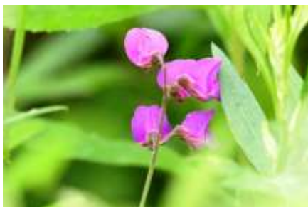
6月 エゾノレンリソウ