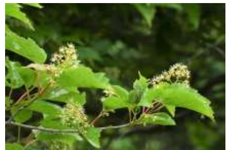
6月 カラコギカエデ