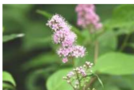
7月 ホザキシモツケ