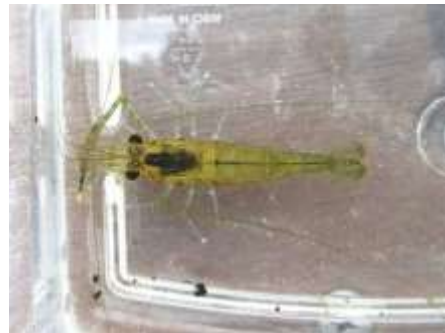
ミナミテナガエビ